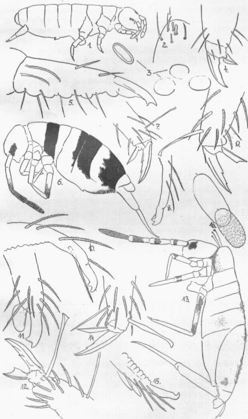
Handschin, Collembolen aus Costa Rica. Erklärung siehe p. 118.